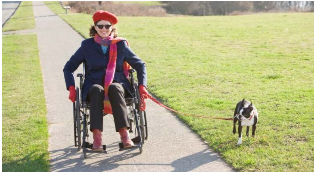
Drastyczna obniżka dofinansowań dla rynku chronionego., foto: Glow Images/ East News

Drastyczna obniżka dofinansowań dla rynku chronionego - średnio o 30 proc., która będzie konsekwencją zrównania dofinansowań na rynku otwartym i rynku chronionym, zaproponowanego przez ustawodawcę od 2014 r, w krótkim czasie doprowadzi do upadłości większość firm zatrudniających niepełnosprawnych - alarmują pracodawcy działający na rynku chronionym.